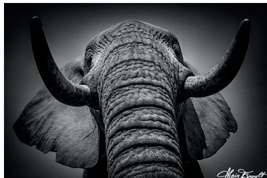
Éléphant de savane d'Afrique