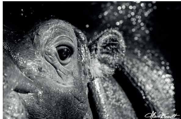
Hippopotame d'Afrique subsaharienne

Qui est le plus grand prédateur de l'hippopotame ? Que récupère-t-il ?