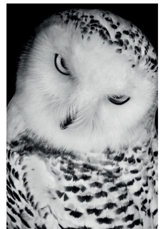
Harfang des neiges