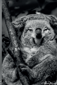
Jeune Koala cendré en Australie