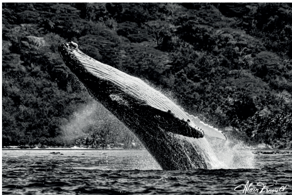
Baleine à bosse