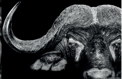
Buffle d'Afrique dans le parc national Kruger en Afrique du Sud