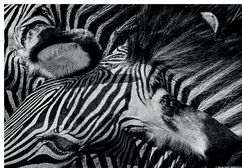
Zèbre de Grévy