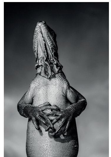
Iguane des Petites Antilles