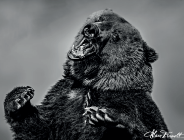
Ours brun d'Europe